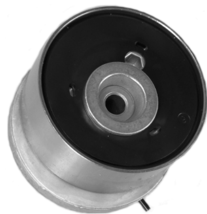
Рис. 2 Новая конструкция

После удаления шестигранного ключа натяжение будет автоматически установлено.